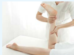
※リンパドレナージュとは、ヨーロッパの医療機関で確立された技術で、現在では海外で治療として確立された手法です。

予防医学を基本としたアロマ・リンパドレナージュ技術が学べます。リンパドレナージュの技術とメディカルアロマを融合させた独自の技術を学ぶことによって、予防医学、アンチエイジングに健康管理、家族のケア、美容、リラクゼーション等、幅広く活用していただけます。